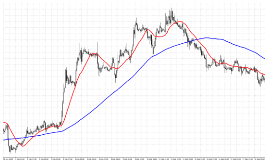
図1 ユーロ/ドルの為替レート変動の一例 (MetaTrader 4[5]を利用して作図、黒:実際の為替レート、赤:短期の移動平均線、青:長期の移動平均線)

移を示すものである。図1は、実際の為替レートの値動きと、移動平均線を図に示したものである。縦軸が為替レート、横軸が時間を表す。黒い線が実際の為替レート、赤い線が短期の移動平均線、青い線が長期の移動平均線を表している。移動平均法では、一般的に長期の移動平均線と短期の移動平均線を組み合わせ、買い注文及び売り注文のタイミングを示すサインとして利用する。短期の移動平均線が長期を上回る現象はゴールデンクロス(GC)と呼ばれ、その時点で通貨の買い注文及び保持中の空売りの締めを行う。また、短期の移動平均線が長期を下回る現象はデッドクロス(DC)と呼ばれ、その時点で通貨の空売り注文及び保持中の買いの締めを行う。